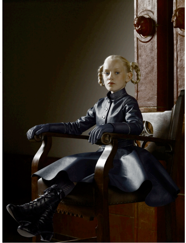
Fotografie - Erwin Olaf - Berlin - 2012 - privécollectie

fotografen van Nederland. Eigenlijk heet hij Erwin Olaf Springveld, maar zijn achternaam is eraf gevallen. Hij groeide op in Hilversum en ging naar de school voor journalistiek in Utrecht. Hij besloot al snel kunstfotograaf te worden en verhuisde naar Amsterdam. Erwin Olaf is homo en maakte in de jaren tachtig choquerende beelden van naakte mannen met erecties en dikke naakte vrouwen in bondagekleding. Hij kreeg eind jaren tachtig al veel bekendheid. In de jaren negentig maakte hij fotoseries over mensen met het Down-Syndroom ('A Mind of Their Own'), oma's in verleidelijke poses ('Mature') en harde foto's van bloed op strakke witte pakken in de serie ' Royal Blood '. In deze laatste serie kreeg Erwin Olaf veel kritiek omdat hij een model als Lady Di