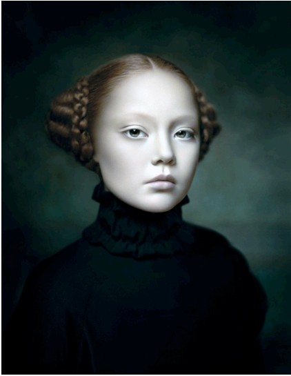
Fotografie - Desiree Dolron - Xteriors XIII - 2001 - Rabobank Kunstcollectie