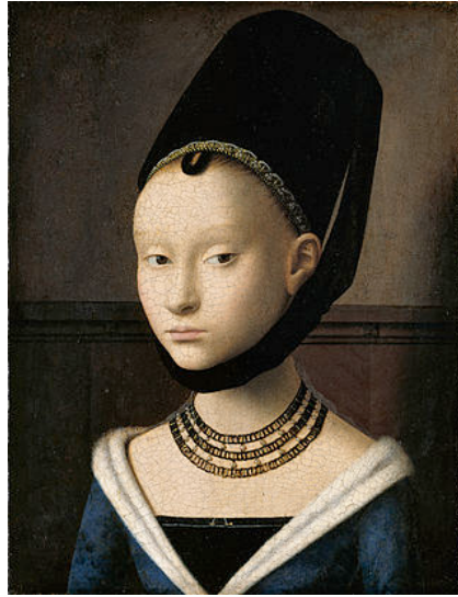
Petrus Christus - Portret van een Jonge Vrouw - 1470 - Gemäldegalerie - Berlijn