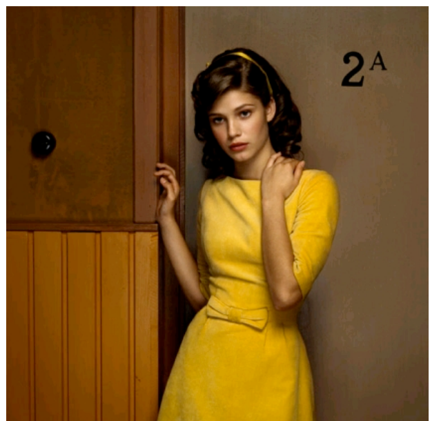
Fotografie - Erwin Olaf - Hope 5 - 2005 - privécollectie (27.000 euro voor betaald, hoogste bedrag tot nu toe op veiling)