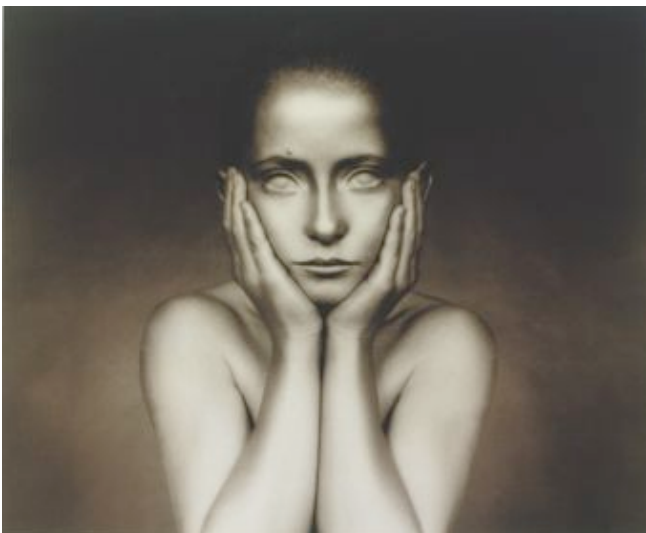
Fotografie - Desiree Dolron - Blind - 1996 - privécollectie - 11 -

Desiree Dolron maakt perfecte beelden. Fotograferen zonder realistisch te zijn. Dat is dus ook mogelijk. En ze is dus autodidact, net als Ans Markus. Onvergetelijke foto's. Ze woont en werkt op het Prinseneiland in Amsterdam.