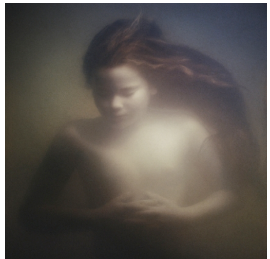
Fotografie - Desiree Dolron - Gaze XV - 1996 - privécollectie