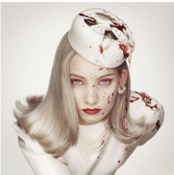
Fotografie - Erwin Olaf - Royal Blood - 2000 - privécollectie

afbeeldde met een Mercedes-ster in haar bloederige bovenarm. Toch begin ik deze serie, 'Royal Blood', voor het eerst pakkend en mooi te vinden. Begin jaren negentig maakt hij nieuwe series die me niet echt raken, tot hij in 2004 en 2005 de series 'Rain' en vooral ' Hope ' maakt. Vanaf dat moment worden zijn werken steeds sterker. In 'Hope' zie je in gedachten verpozen mensen, die hopen op wat geluk. Eén werk van 'Hope', werd op een veiling voor 27.000 euro verkocht (het hoogste tot nu toe op een veiling). In 2010 maakt hij de serie ' Hotel ' over losbandige vrouwen (en één man) in broeierige hotelkamers; foto's met een verhaal. De allermooiste serie tot nu toe van Erwin Olaf vind ik ' Berlin ' uit 2012, waarin hij de sfeer uit de jaren twintig en dertig in Berlijn uitbeeldt. Nette huizen en keurige mensen, maar er hangt iets dreigends in de lucht. Een beetje als de chique interieurs van schilder Jan Worst, maar dan in de strakke art deco van het interbellum. Zwart leer in grijze en donkerbruine interieurs. Heel indrukwekkend.